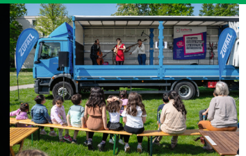
DER ROLLENDE GEORG