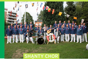
SHANTY CHOR GÖTTINGEN